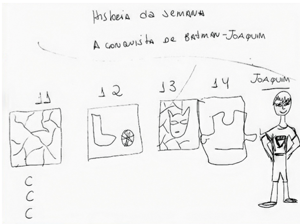
Figura 1 – “A conquista de Batman-Joaquim”